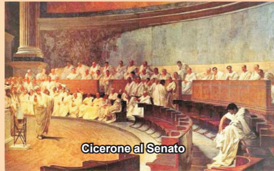
Cicerone al Senato

Con questo sistema Verre si arricchì in modo incredibile e riuscì ad accumulare una tale quantità di denaro, che gli permise di acquistare un enorme numero di oggetti d'arte, di cui era appassionato. Lo apprendiamo dal racconto che mi fa Cicerone nelle "Verine" allorché descrive la spoliatura di due statue, che si trovavano nella città di Enna e dei decori e delle argenterie, che possedevano la città e gli abitanti di Alunzio.