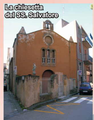
La chiesetta del SS. Salvatore