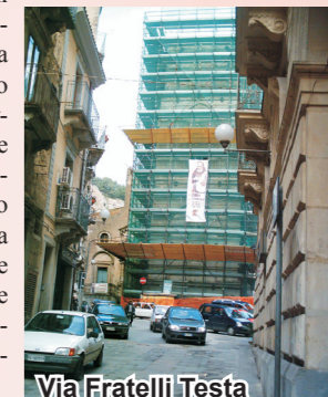
Via Fratelli Testa

E' stato approvato, nell'ultima seduta del Consiglio comunale, il bilancio di previsione per l'anno 2009. Negli stati di previsione, sono previsti interventi da realizzare nel settore della viabilità e delizia delle ultime amministrazioni comunali. Tra gli interventi uno in particolare balza all'attenzione e solleva qualche preoccupazione: l'espletamento di un intervento nella centralissima via Fratelli Testa nodo nevralgico della circolazione veicolare urbana. Nella fattispecie l'intervento consisterebbe nella ripavimentazione dell'arteria urbana e nel possibile allargamento del marciapiede di che la costeggia.