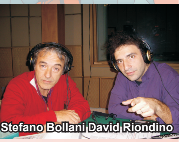
Stefano Bollani David Riondino

Stefano Bollani, pianista e compositore jazz di livello internazionale. Nel 2007 a Vienna ha ricevuto lo European Jazz Prize. David Riondino, nasce come artista con la generazione dei cantautori degli anni Settanta. Nel 1975 debutta allo Zelig di Milano, iniziando un percorso formativo che passa per la TV, ma la sua attività principale resta il teatro. Ispirato alla trasmissione di Radio3, il Dottor Djembè, divagazioni musicali, filosofiche ed esistenziali dell'ineffabile coppia, nasce "Lo Zibaldone del Dottor Djembè", un CD più libro. Quasi un trattato di musicologia, ricco di documenti, foto, spartiti, recensioni, che sotto sotto cela un'autentica parodia del modo di fare cultura musicale oggi. Importanti quanto strampalati quesiti vengono sviscerati. Strani reperti vengono analizzati, personaggi ancora più improbabili irrompono dalle pagine. Sono solo alcuni esempi presentati nel trattato. Tutto questo sotto la supervisione del dottor Djembè, figura di cui poco si sa, ma quanto basta per venerarlo come nume tutelare della produzione musicale mondiale di tutti i tempi. Il cd allegato contiene i documenti sonori originali analizzati nel libro. Per gli appassionati e non, è un'occasione da non perdere: divertente e surreale.