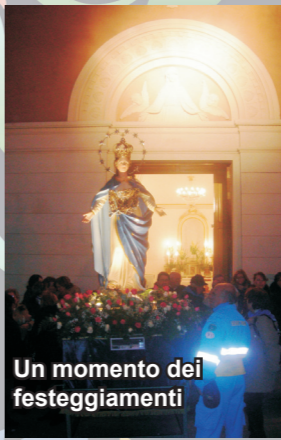
Un momento dei festeggiamenti